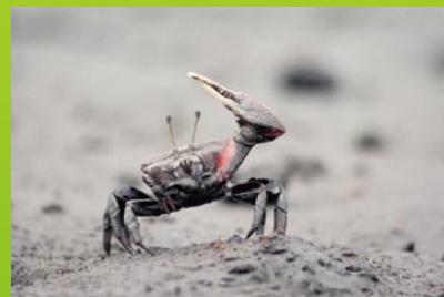
吉野川(シオマネキ)