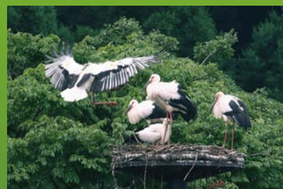
円山川下流域(コウノトリ)