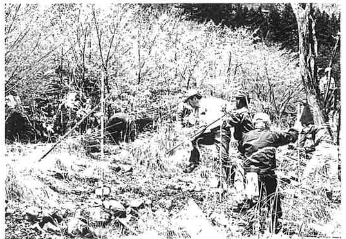
< 昨年の作業風景 >

[注意] 1 「足尾に緑を育てる会」のチラシ(別紙)を同封します。参考にして下さい。「わたらせ未来基金」は一緒に活動していますが、植樹は別の場所で行います。集合場所に注意して下さい。特に 集合B(2次集合)に遅れないようにして下さい。 →遅れるとゲートが閉まってしまって、入れなくなりますのでご注意下さい。